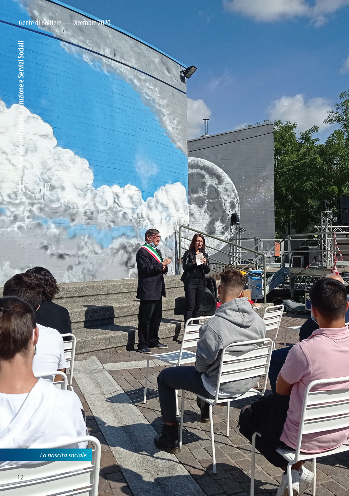
La nascita sociale