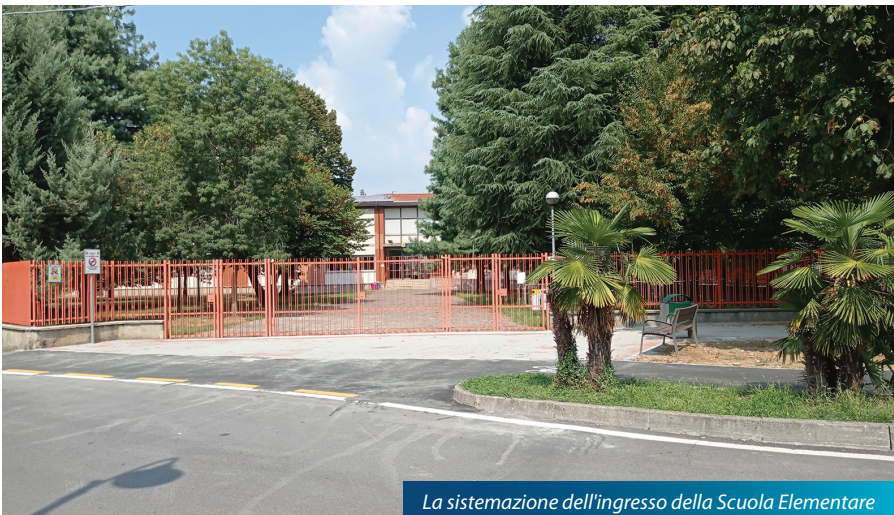
La sistemazione dell'ingresso della Scuola Elementare

È in corso poi una doverosa e necessaria ristrutturazione di parte del Cimitero . Oltre alla sistemazione delle tombe poste nell'ala nuova, si è proceduto alla sostituzione di parte dei marmi nell'area dei loculi interrati.