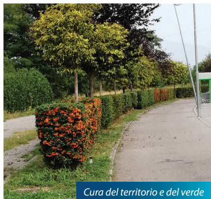
Cura del territorio e del verde