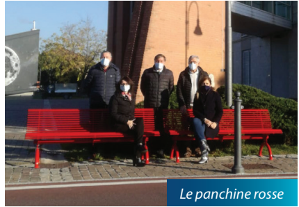
Le panchine rosse