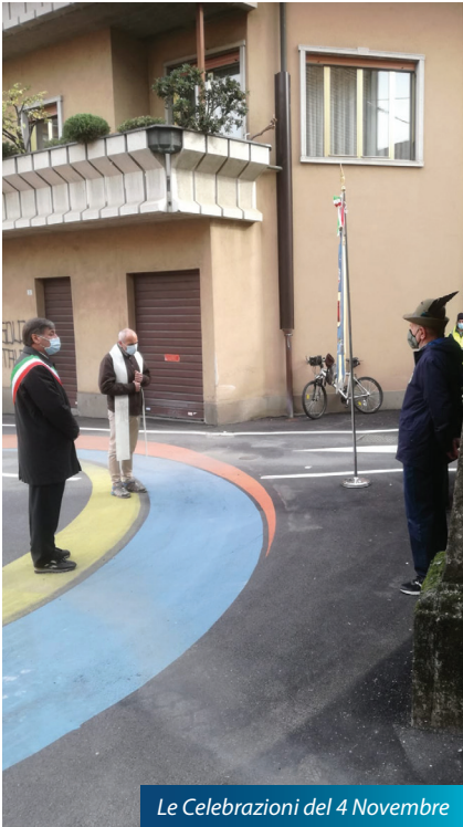
Le Celebrazioni del 4 Novembre