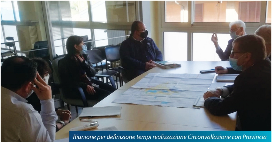
Riunione per definizione tempi realizzazione Circonvallazione con Provincia

soluzioni di finanziamenti e soluzioni tecniche di intervento, finalizzata con il contributo totale per il realizzo dell'importante variante di ben 5 milioni suddivisi in 3 anni. Il completamento dell'opera avverrà sicuramente entro fine 2023 ma forse anche in tempi più brevi con un cronoprogramma già accordato con la Provincia che realizzerà i lavori dell'importante infrastruttura.