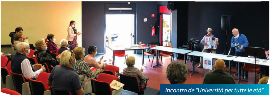
Incontro de "Universit  per tutte le et "

territorio comunale due panchine rosse , segno di questa giornata.