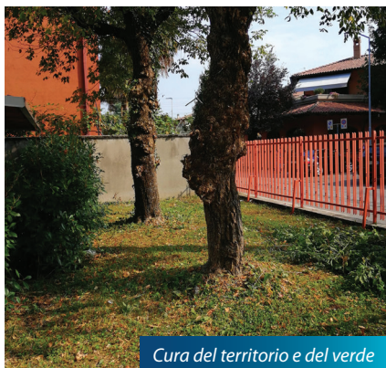
Cura del territorio e del verde

Il comune di Boltiere ha aderito, infine, in collaborazione ad Agenda21 all'iniziativa " Comuni senza plastica ", progetto per eliminare dagli ambienti comunali la plastica dai distributori automatici. Uno degli effetti della pandemia da Covid19 è stato proprio il ricorso a prodotti mono uso, i quali purtroppo molto spesso vengono abbandonati e gettati nell'ambiente. Un problema dentro il problema, dato che come abbiamo constatato l'inquinamento aiuta la circolazione del virus. Proprio per questi motivi, l'assessorato all'Ambiente ha attivato un percorso di eliminazione delle plastiche monouso. Grazie all'aiuto di operatori esterni, come ad esempio Alfa Express , a breve tutti i contenitori di plastica verranno sostituiti da materiale compostabile all'interno del comune. Questo ci permetterà di ricevere un importante riconoscimento, ovvero il " no plastic more fun " di Worldrise Onlus .