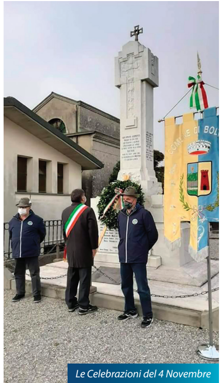
Le Celebrazioni del 4 Novembre

Un'attività anche questa fortemente necessaria.